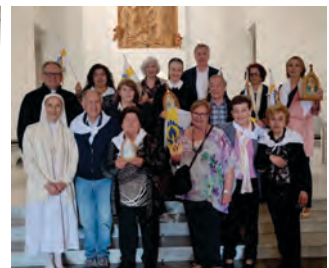
Pilgerfahrt nach Sranta Marinella