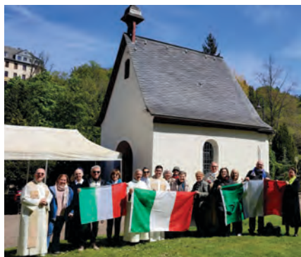
Wallfahrt nach Schönstatt: Messe im Urheiligtum