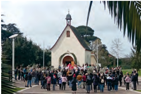
Karwoche in Belmonte