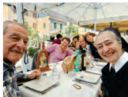
Santa Marinella: die Pilgernde Gottesmutter im Restaurant