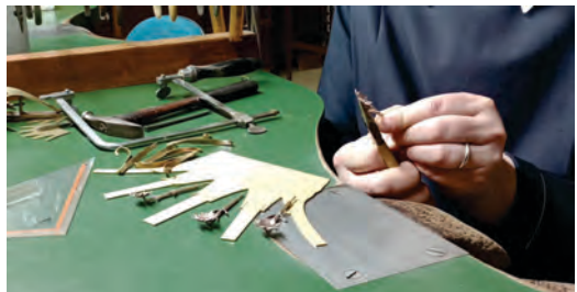
Krone der Muttergottes in Bearbeitung