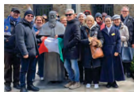
Wallfahrt nach Schönstatt: mit Pater Kentenich