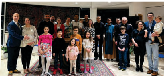
Karwoche in Belmonte