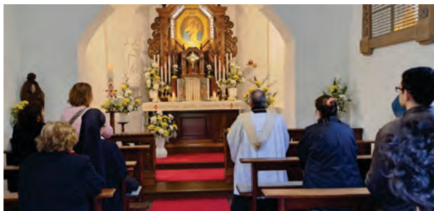
Karwoche in Belmonte