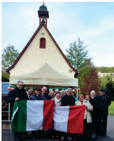
Wallfahrt nach Schönstatt: Eröffnung der Wallfahrt