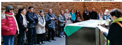
Wallfahrt nach Schönstatt: zum Grab des Gründers