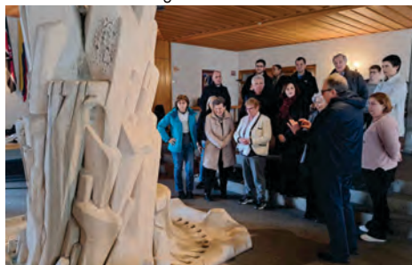
Wallfahrt nach Schönstatt: Abschluss der Wallfahrt zum Berg Moria