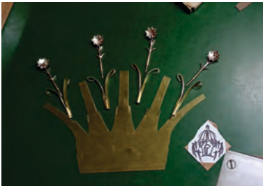
Krone wird bearbeitet