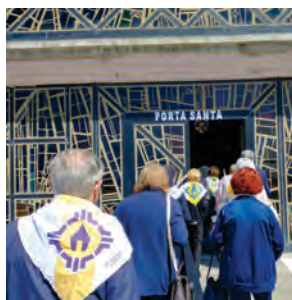
Santa Marinella: Heiligen Pforte